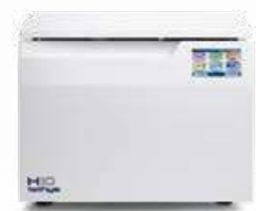
Tethys H10 plus TERMIDISINFEZIONE