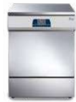
Tethys T60 - Tethys D60