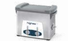
Highea 3 LAVAGGIO