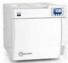
B Classic AUTOCLAVI