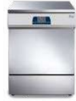
Tethys T60 - Tethys D60