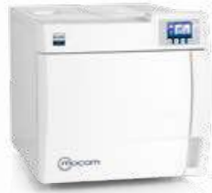
B Classic AUTOCLAVI