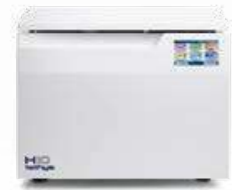
Tethys H10 plus TERMIDISINFEZIONE