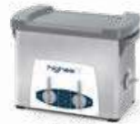
Highea 3 LAVAGGIO